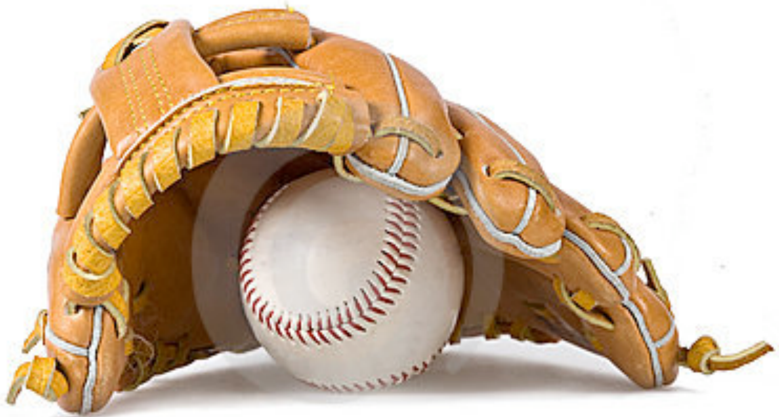
Sporty Still Life