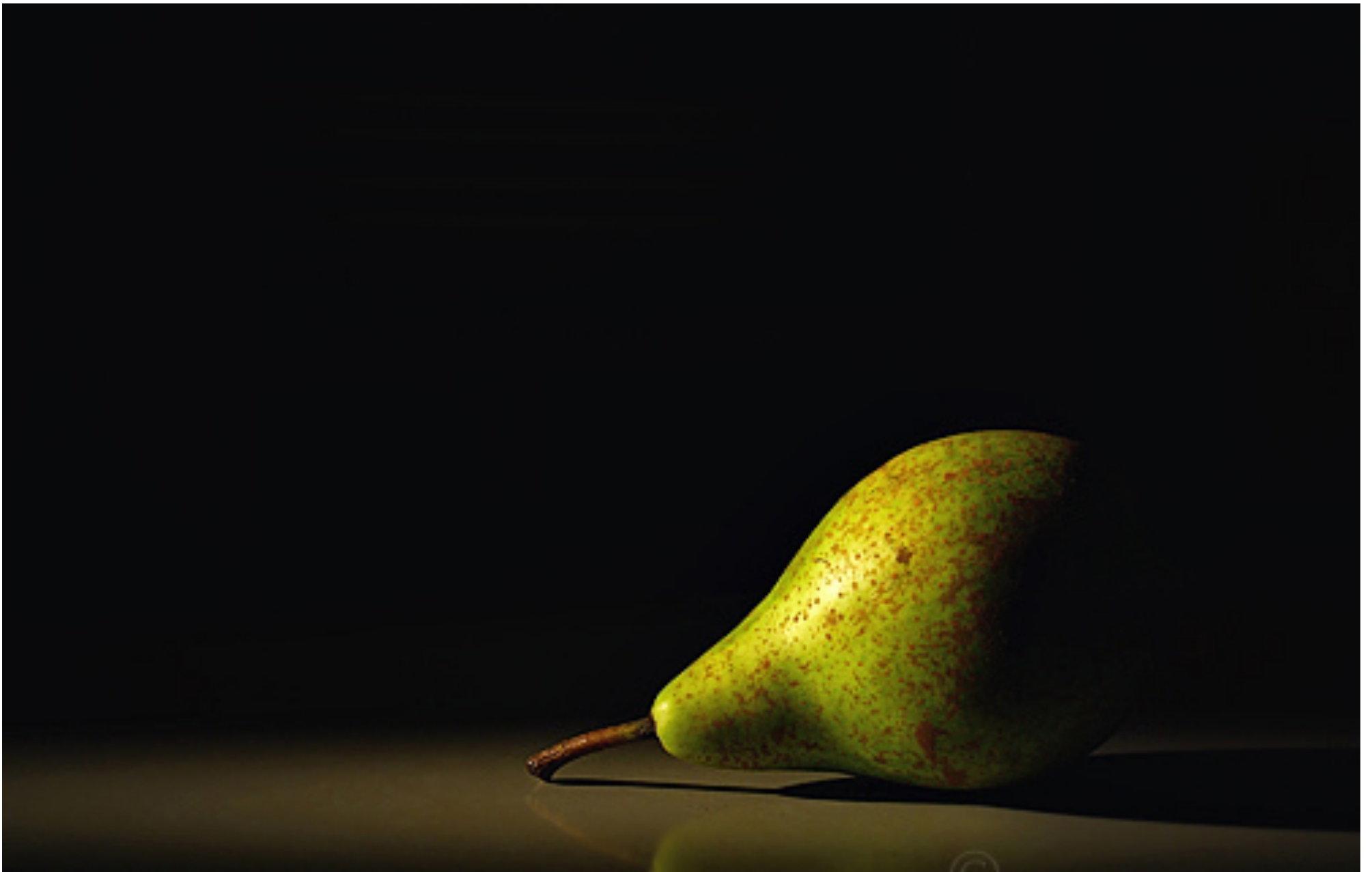
Simple Still Life