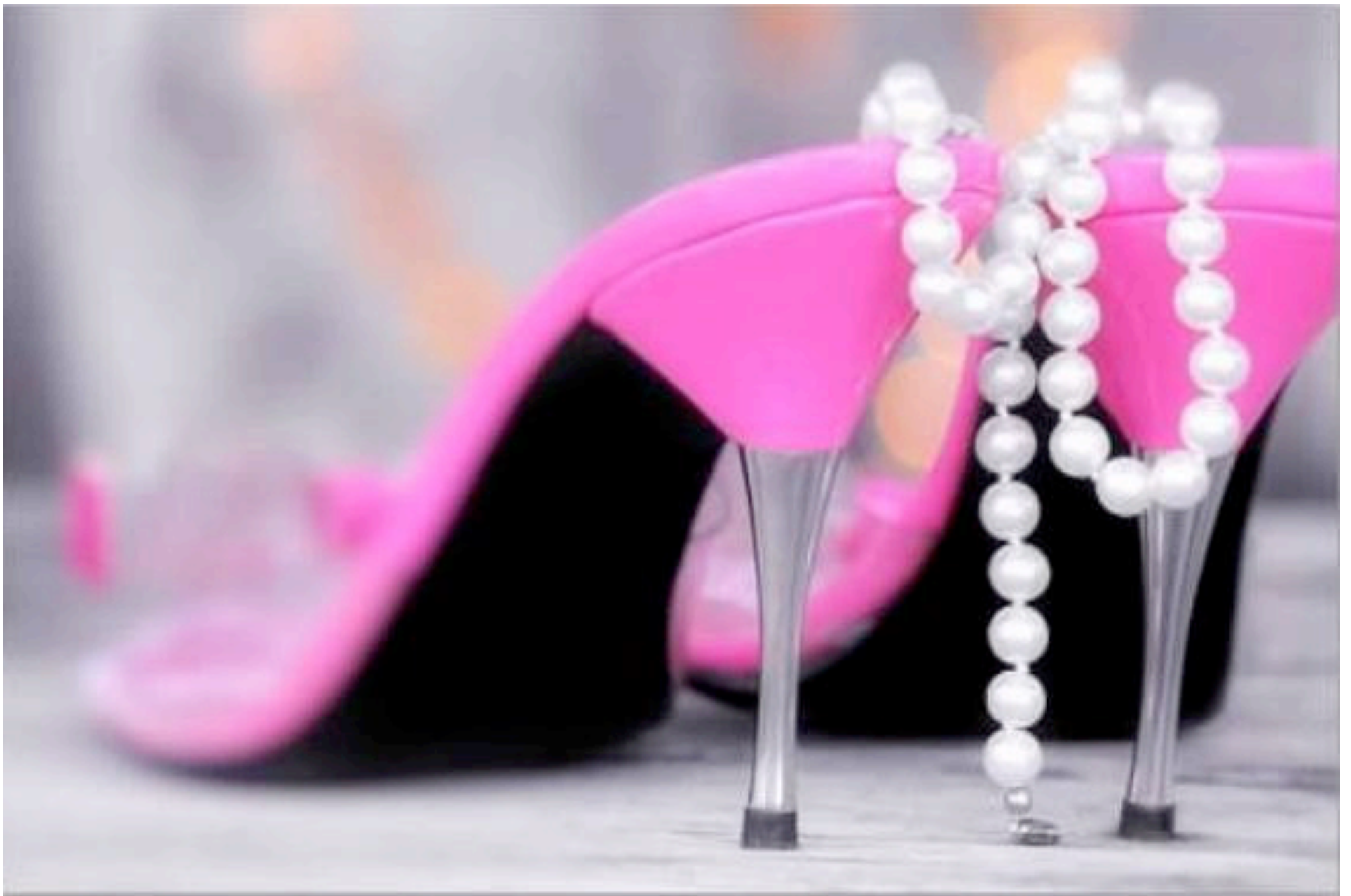
Feminin Still Life