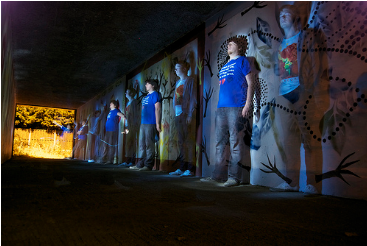
F/4, 240 detik, bulb. perhatikan bahwa kedua model diatas harus berpindah dari satu titik ke titik lain