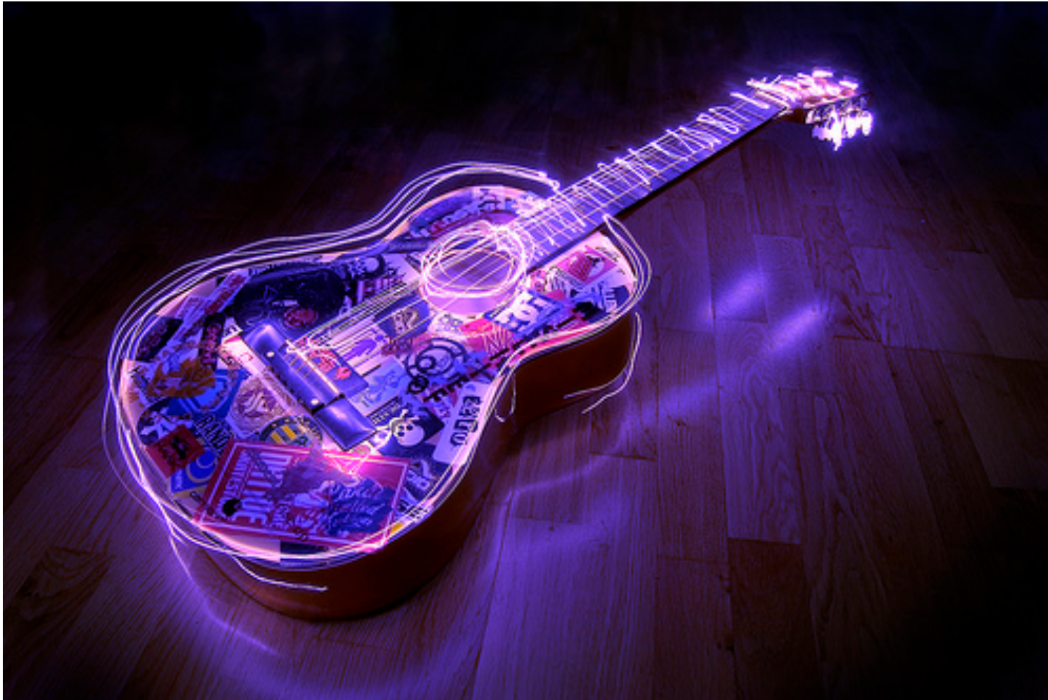
Light painting to Guitar Object