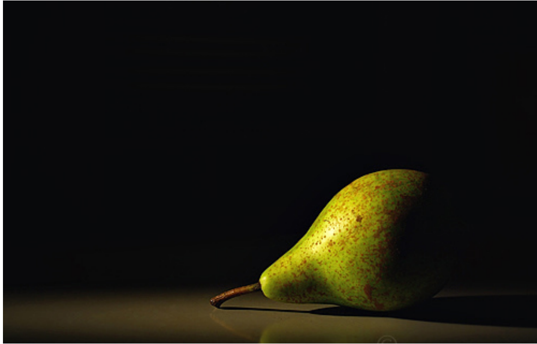
Simple Still Life