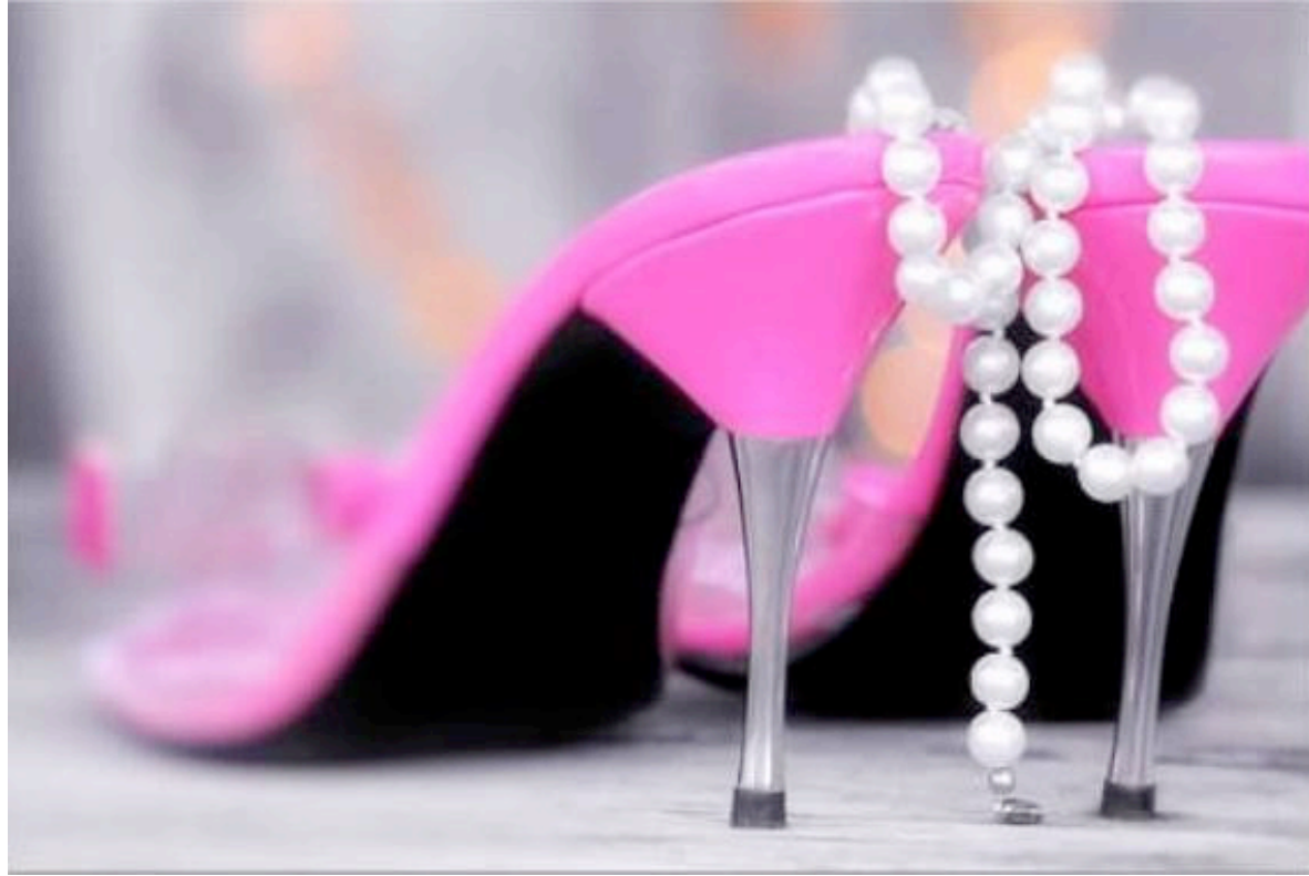
Feminin Still Life