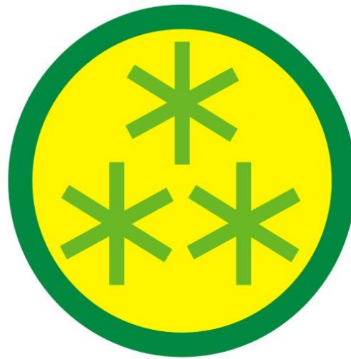
Logo Obat Herbal Terstandar