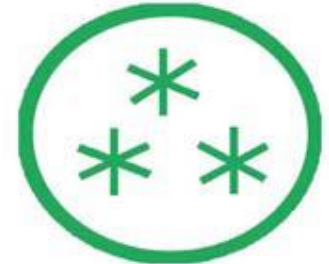
OBAT HERBAL TERSTANDAR