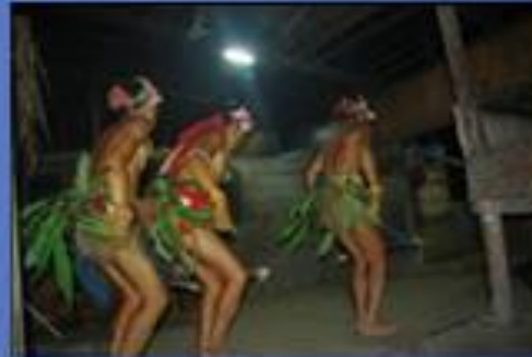
Tari Turuk Pokpok dari Mentawai