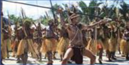
Tari Perang dari Papua