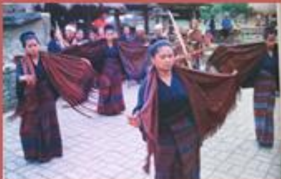
Tari Minta hujan (NTT)